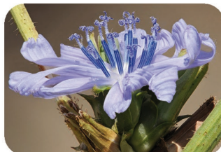
Chicorée sauvage Cichorium intybus