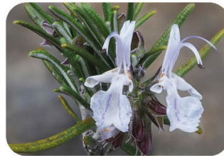
Romarin Rosmarinus officinalis