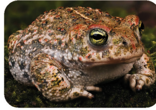
Crapaud des joncs ou Calamite Bufo calamita