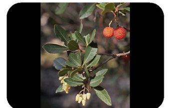
Arbousier Arbutus unedo