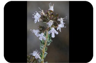
Thym vulgaire Thymus vulgaris