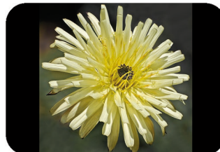
Urosperme de Daléchamp Urospermum picroides