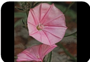
Liseron fausse de Biscaye Convolvulus althaeoides