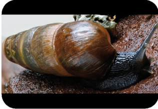
Bulime tronqué Rumina decollata