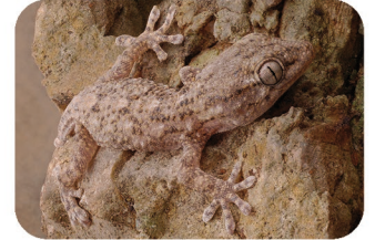
Tarente commune Tarentola mauritanica