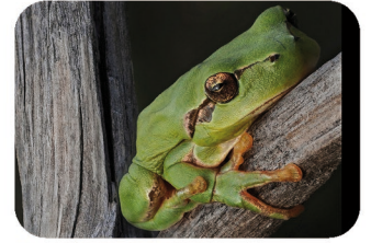
Rainette méridionale Hyla meridionalis