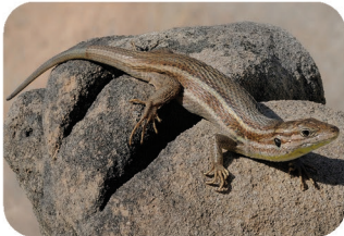
Psammodrome d'Algérie ou Algire Psammodomus algirus