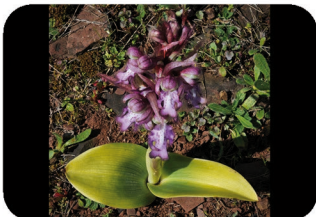
Barlie de Robert Barlia robertiana