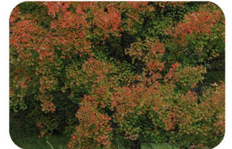
Erable Acer monspessulanum