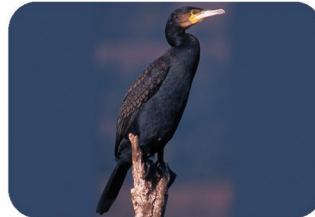
Le Grand Cormoran Phalacrocorax carbo