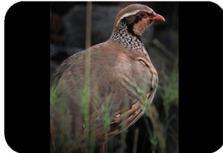
Perdrix Rouge Alectoris rufa