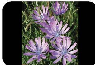
Laitue vivace Lactuca perennis