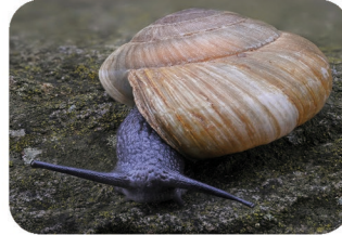
Zonite d'Algérie Zonites algirus