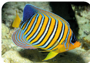
Poisson-ange royal Pygoplites diacanthus