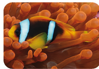
Poisson-clown à deux bandes Amphiprion bicinctus