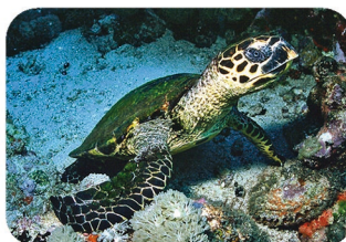
Tortue à écailles Eretmochelys imbricata