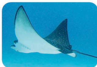
Raie aigle léopard Aetobatus narinari