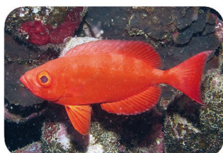
Priacante commun (gros-yeux) Priacanthus hamrur