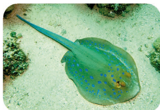
Raie pastenague à points bleus Taeniura lymma