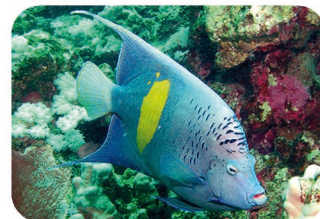
Poisson-ange géographe Pomacanthus maculosus