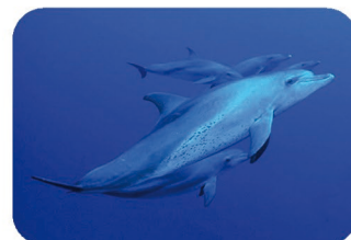
Dauphin gros nez de l'océan Indien Tursiops aduncus