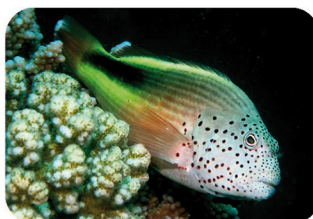
Poisson faucon à taches de rousseur Paracirrhites forsteri