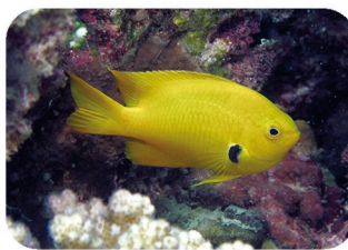
Demoiselle soufrée Pomacentrus sulfureus