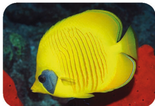
Poisson-papillon jaune Chaetodon semilarvatus