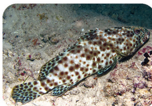
Mérou loutre Epinephelus tauvina