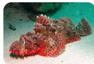
Poisson-scorpion à tête plate Scorpaenopsis oxycephala