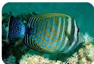
Poisson-chirurgien voilier Zebrasoma desjardinii