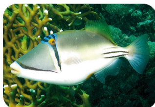
Baliste Picasso arabe Rhinecanthus assasi