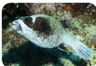
Tétrodon masqué Arothron diadematus