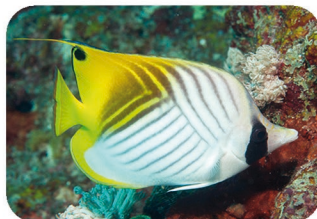
Poisson-papillon cocher Chaetodon auriga