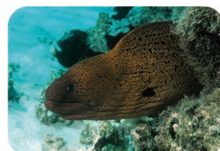
Murène géante Gymnothorax javanicus