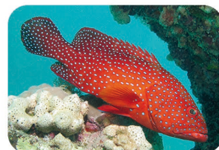
Mérou rouge à points bleus Cephalopholis miniata