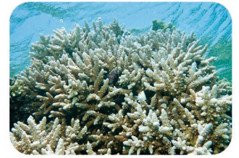
Acropores branchus Acropora spp.