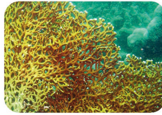
Corail de feu ramifié Millepora dichotoma

Assurez-vous que vous prenez bien la bonne espèce en photo. Seule l'espèce scientifique mentionnée sur la plaquelette sera valide . Vous pouvez redimensionner vos photos avant de les déposer sur votre compte internet, mais vous devez conserver les originaux sans modifications : ils pourront vous être demandés pour contrôle. funexplorers.fr