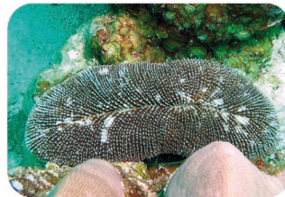
Corail-champignon allongé Ctenactis sp.