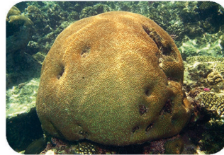
Corail cerveau Platygyra sp.