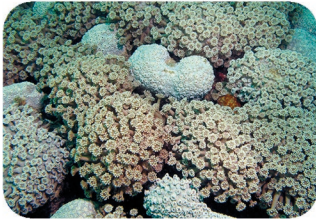
Goniopore (corail marguerite) Goniopora sp.