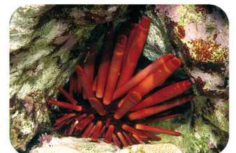
Oursin crayon Heterocentrotus mammillatus