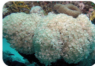
Xenia Xenia sp. / Heteroxenia sp.