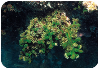
Tubastrée arborescente Tubastrea micrantha