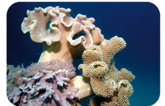
Corail-cuir champignon Sarcophyton sp.