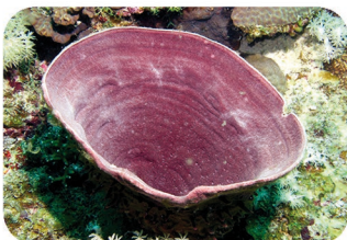
Eponge calice Callyspongia crassa