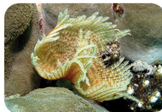
Sabelle éventail Sabellastarte indica