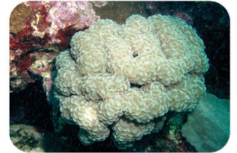
Corail bulle Plerogyra sp.