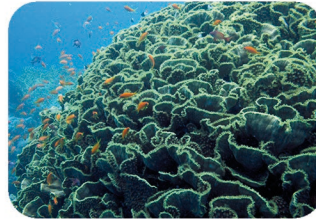
Corail turbinaire Turbinaria sp.