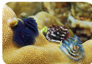
Ver arbre de Noël Spirobranchus giganteus