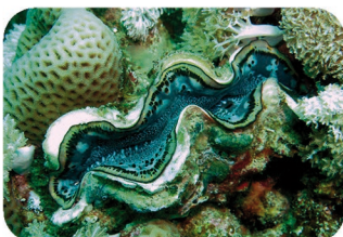
Bénitier Tridacna sp.