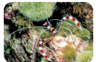
Crevette nettoyeuse zébrée Stenopus hispidus