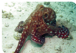
Poulpe de récif Octopus cyaneus