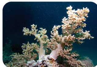
Alcyonaire arborescent Litophyton arboreum