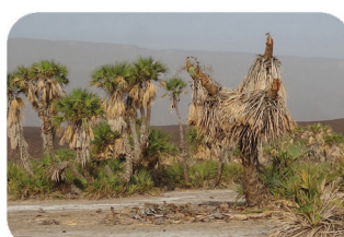
Palmier-doum Hyphaene thebaica