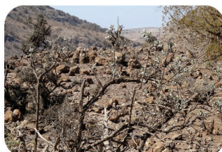
Faux-camphrier Tarchonanthus camphoratus