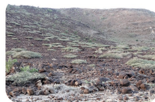
Acacia horrida Acacia horrida