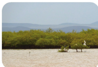
Palétuvier Avicennia marina