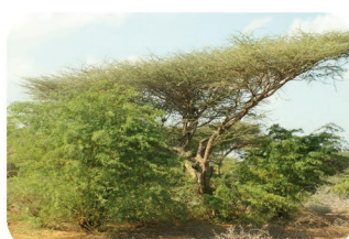
Mesquite (Bayarone) Prosopis chilensis ou P. juliflora