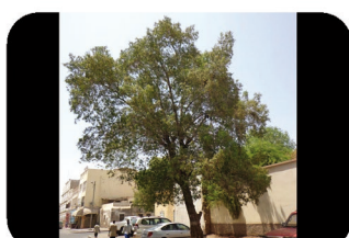
Laurier du Yémen (ou de Somalie) Conocarpus lancifolius