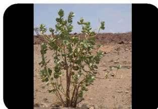
Pommier de Sodome Calotropis procera