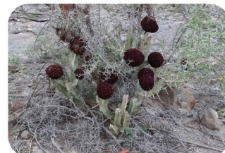
Carallume Desmidorchis acutangula