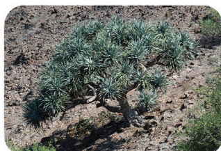
Dragonnier Dracanea ombet