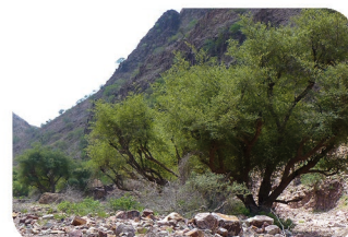
Jujubier Ziziphus mauritiana