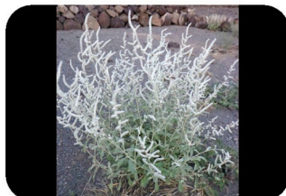
Aerva (« l'envahissante ») Aerva javanica