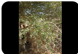
Balanite à feuilles rondes Balanites aegyptiaca