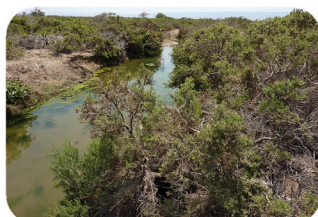
Soude Suaeda fruticosa