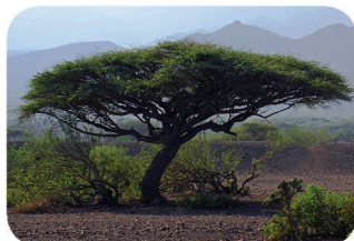
Acacia parasol Acacia tortilis (var spirocarpa)