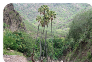
Palmier de Bankoualé Livistona carinensis