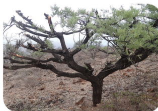
Acacia etbaica Acacia etbaica