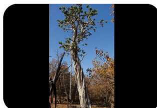
Figuier étrangleur Ficus vasta