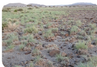
Herbe à chameau (ou à âne) Cymbopogon schoenanthus