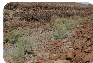
Tamaris Tamarix nilotica