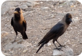
Corbeau Indien Corvus splendens