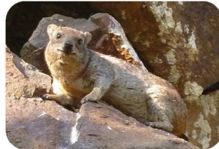
Daman des rochers Procyon capensis