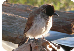
Bulbul commun Pycnonotus barbatus