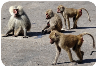
Hamadryas Papio hamadryas