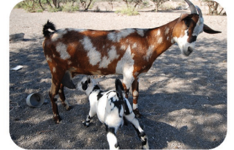
Chèvre domestique Capra aegagrus