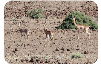
Gazelle de Waller (gerenuk) Litocranius walleri