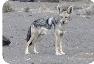
Chacal commun Canis adustus