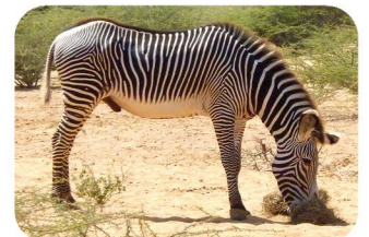
Zèbre de Grévy Equus grevyi