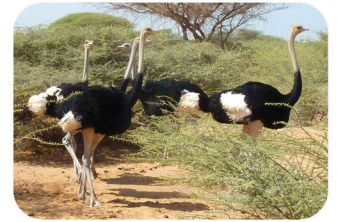
Atruche Struthio camelus ssp