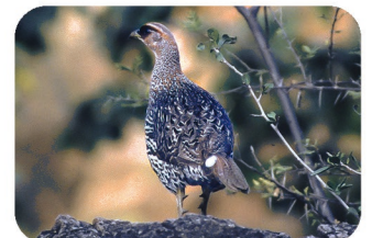
Francolin de Djibouti Francolinus ochropectus