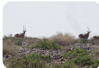
Oryx beisa Oryx beisa