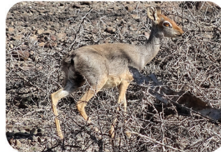
Dik-Dik de Salt Madoqua saltiana