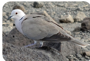
Tourterelle rieuse Streptopelia roseogrisea