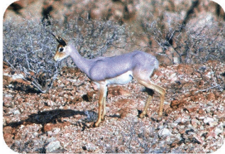
Beira Dorcatragus megalotis