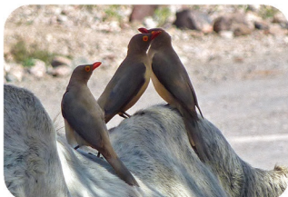
Pique-boeuf Buphagus erythrorhynchus