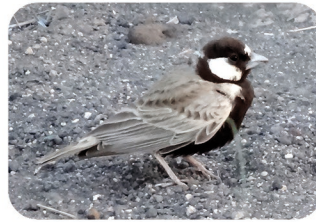
Alouette-moineau à front blanc Eremopterix nigriceps