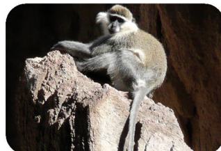
Singe vert (grivet) Chlorocebus aethiops