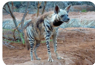
Hyène rayée Hyaena hyaena