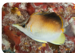
Poisson-papillon Pinocchio Chaetodon aculeatus