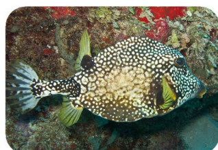
Poisson-coffre mouton (Lactophrys triquetra)