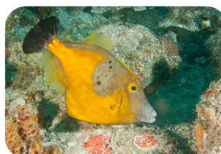
Bourse cabri Cantherhines macrocerus