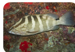
Mérou de Nassau Epinephelus striatus