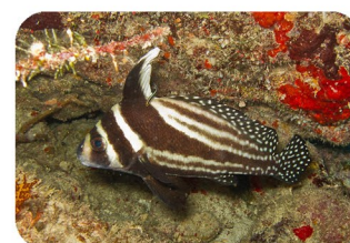
Chevalier ponctué Equetus punctatus