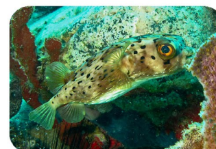
Didon petit porc-épic Diodon holocanthus