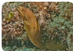
Murène porcelaine Gymnothorax miliaris