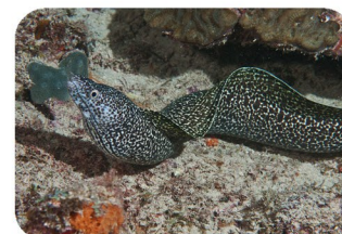
Murène noire Gymnothorax moringa