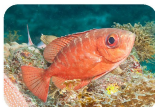
Poissons soleils Priacanthus spp