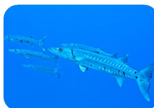
Barracuda Sphyaena picudilla