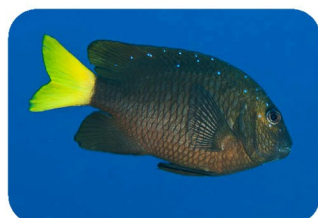
Demoselle à queue jaune Microspathodon chrysurus