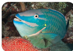
Poisson-perroquet tricolore mâle Sparisoma viride livrée terminale