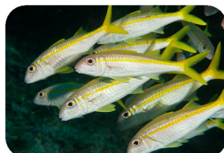
Barbarin blanc Mulloidichthys martinicus