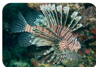
Poisson lion Pterois volitans