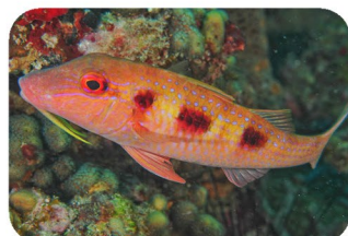
Barbarin rouge Pseudupeneus maculatus