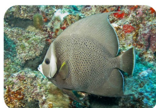
Poisson-ange gris Pomacanthus arcuatus