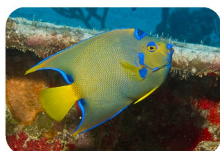
Poisson-ange royal Holacanthus ciliaris